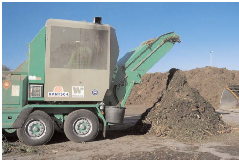
A l'entrée de la plateforme, tous les déchets verts sont broyés

A l'entrée de la plateforme de compost, les camions sont pesés mais aussi contrôlés. S'il y a du plastique ou du fil de fer, le camion peut être refusé par l'entreprise. Les déchets verts sont alors