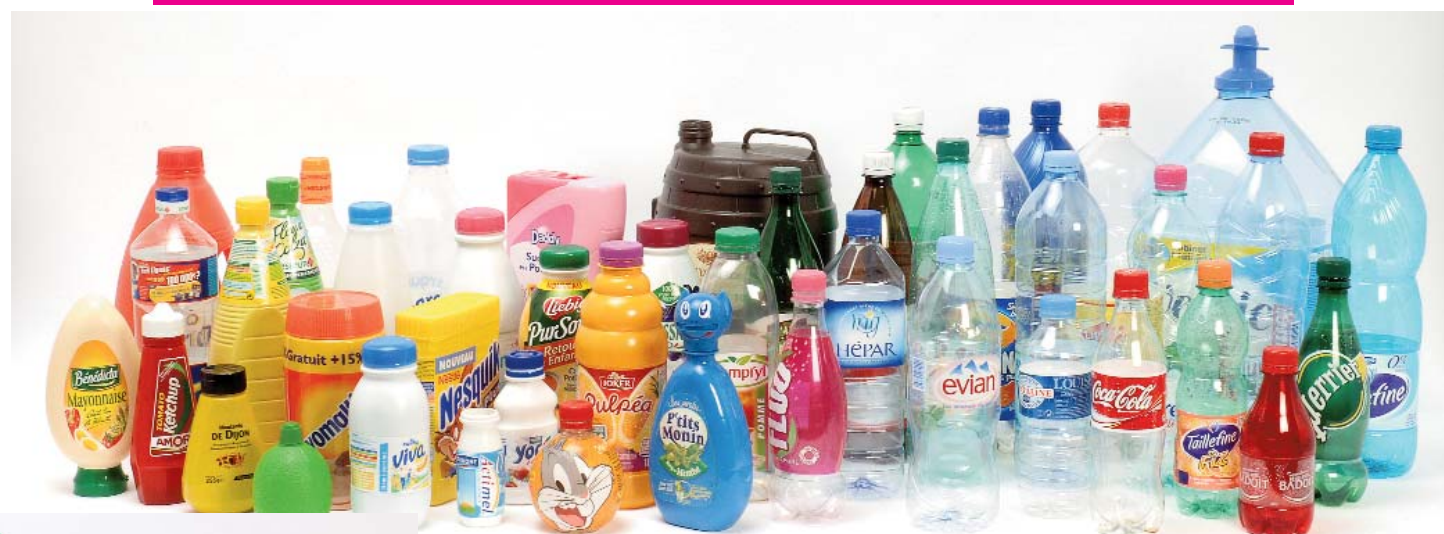
Les bouteilles et flacons alimentaires

Tous les emballages en plastique à mettre dans le bac jaune