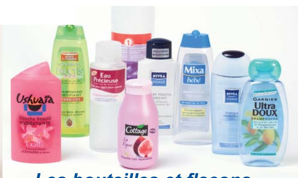
Les bouteilles et flacons de produits d'hygiène

Pour recycler, il faut trier ! Pour recycler, il faut trier ! Pour recycler, il faut trier !