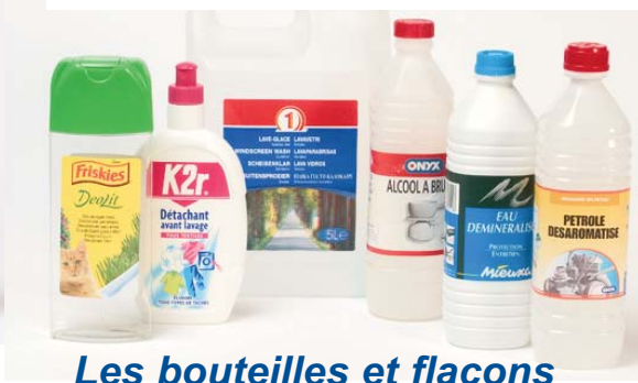
Les bouteilles et flacons divers