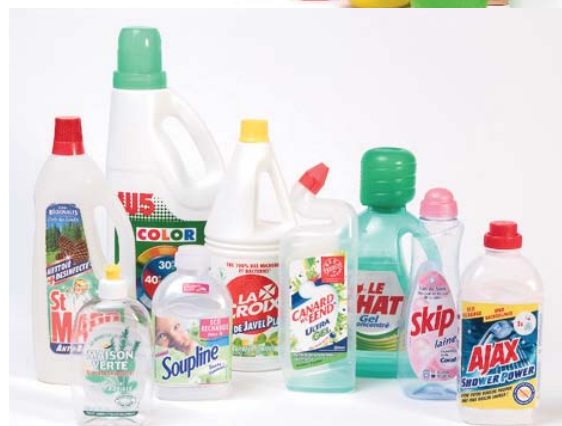
Les bouteilles et flacons d'entretien