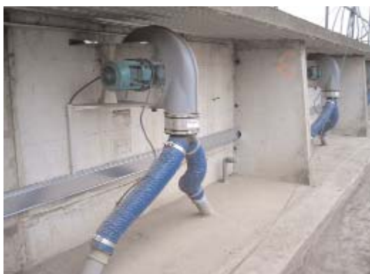
Les nouveaux ventilateurs installés à la mi-mars

Pour recycler, il faut trier ! Pour recycler, il faut trier ! Pour recycler, il faut trier !