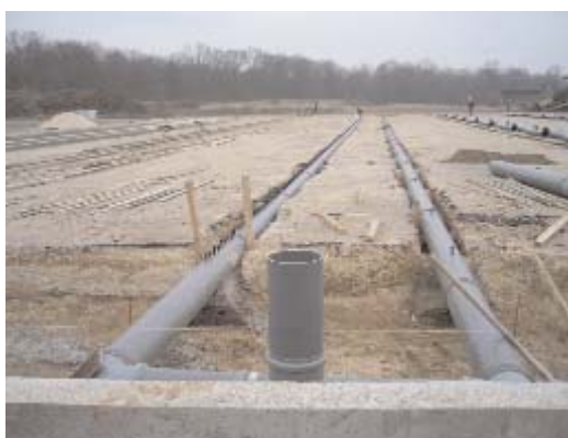
Le nouveau système basé sur la ventilation devrait venir à bout des mauvaises odeurs