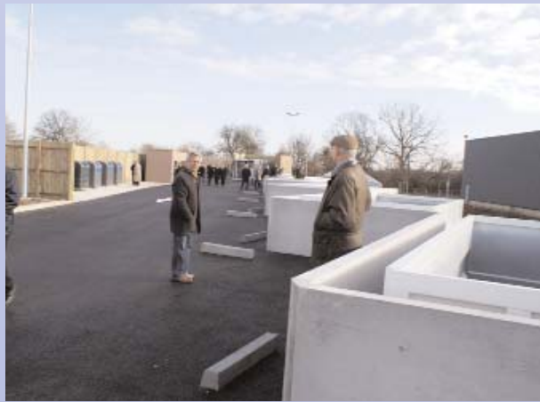
Chaque benne à quai est destinée à recevoir un certain type de déchets : gravats, déchets verts, tout-venant...