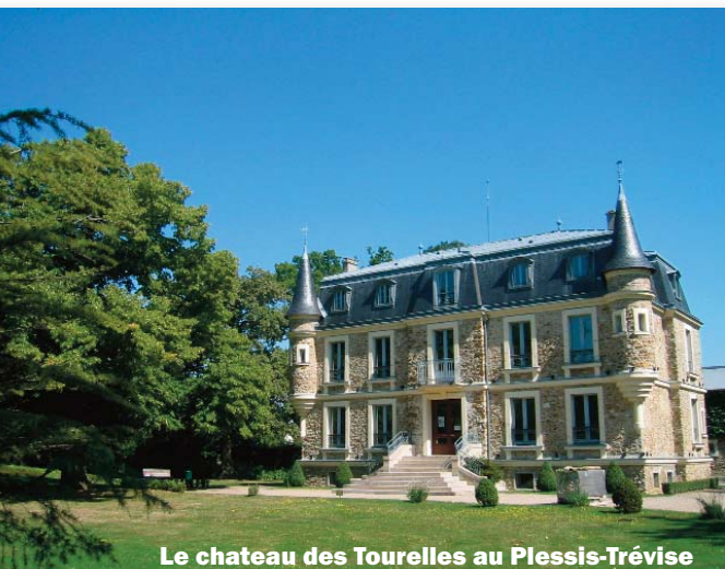
Le chateau des Tourelles au Plessis-Trévisé