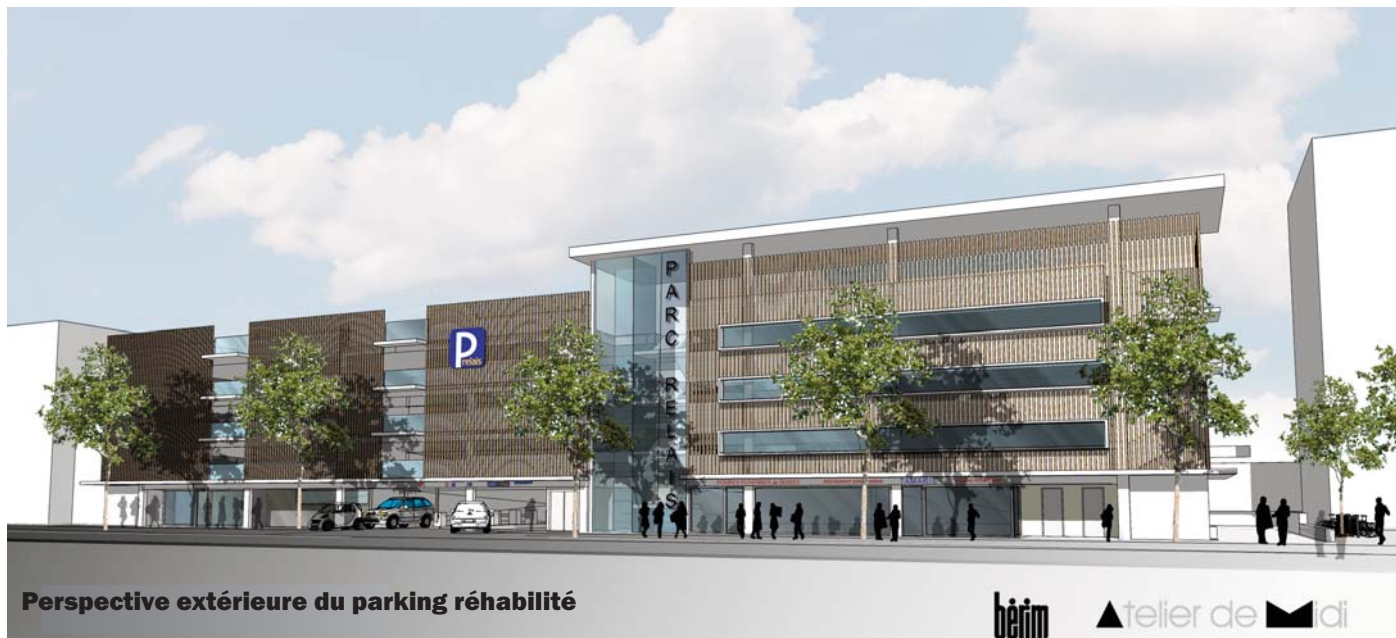
Perspective extérieure du parking réhabilité