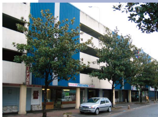
Le parc relais aujourd'hui

Le montant total des travaux s'élève à 5 556 372 € TTC. Le STIF finance l'opération à hauteur de 2 800 000 €.