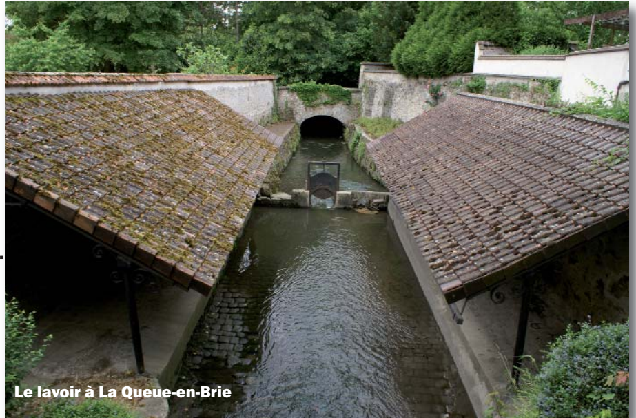
Le lavoir à La Queue-en-Brie

Les 4 itinéraires ont été présentés pour la première fois sur le stand de la Communauté d'Agglomération lors de la fête de l'Arc Boisée, le dimanche 9 octobre dernier dans la forêt de Grosbois à Boissy-Saint-Léger, organisée par le Conseil général du Val-de-Marne.