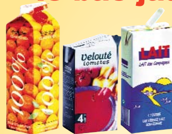
Les briques alimentaires