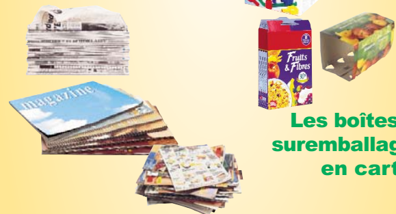
Les journaux- magazines - prospectus- catalogue- annuaire - papier blanc